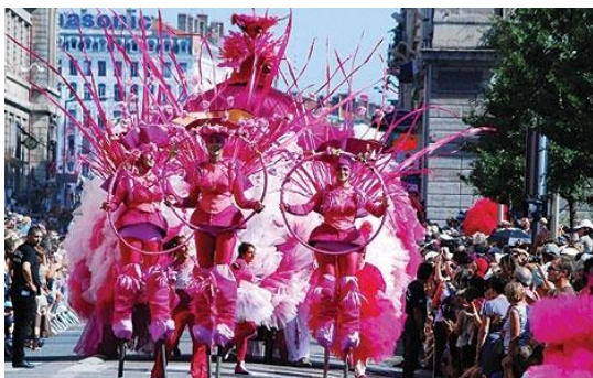
Le pink carnaval