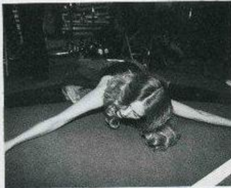
De voorbereidingen voor het winterdefilé van Mais il est où le Soleil, en een beeld uit de spraakzachtige show.