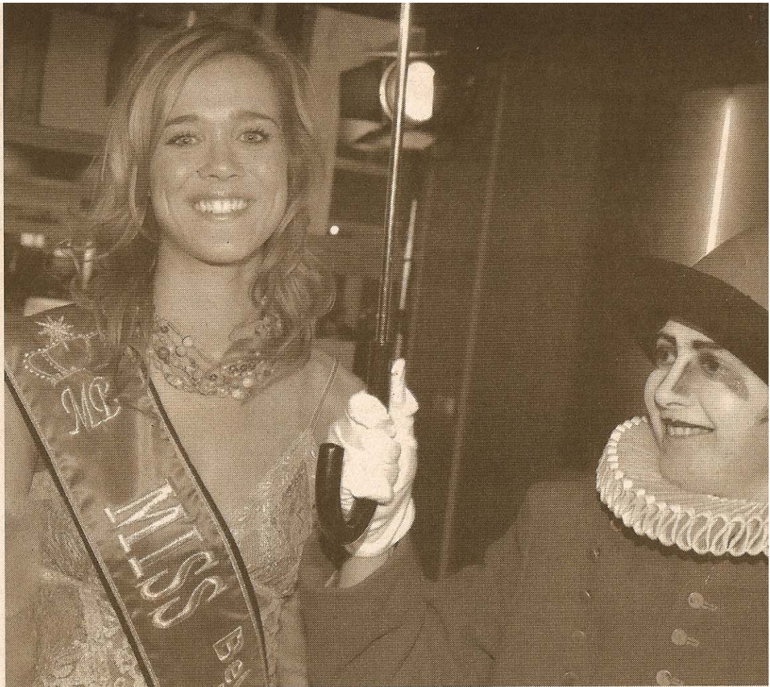
Le charmant sourire de Miss Belgique était indispensable à la fête. □ L. LANGE

Le casino, ouvert le 19 décembre dernier, a déjà rapporté à la Région bruxelloise 176.346€ en taxes sur les jeux et paris pour ses treize premiers jours d'exploitation. ■■