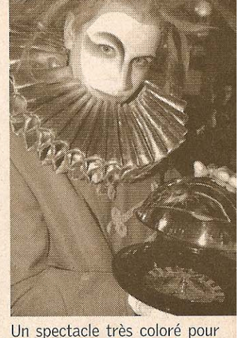
Un spectacle très coloré pour