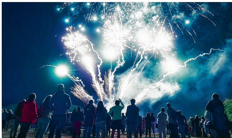
Vers 23 heures, le feu d'artifice final.

Emportés par de puissantes et angéliques mélodies baroques, perdez-vous dans les méandres végétaux du domaine de Beloeil. Dans