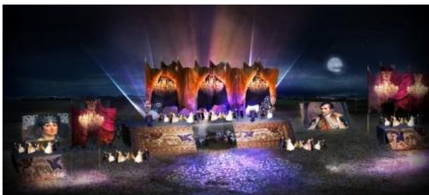
Un des tableaux d' Inferno