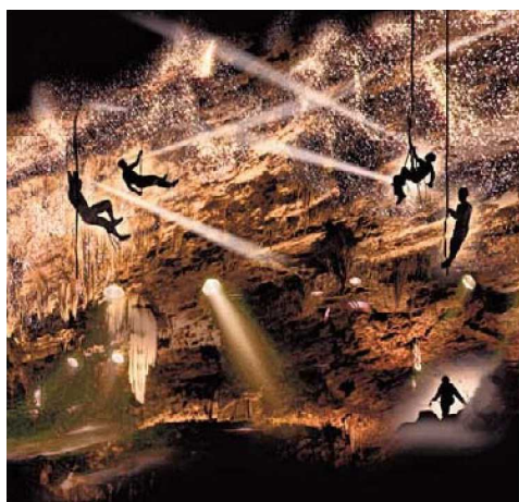
➤ Een 360° spektakel voor groot en klein.