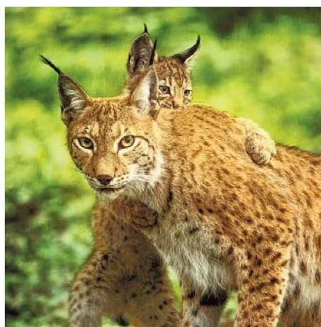
➤ Kom oog in oog te staan met de elegante lynx.

de prachtige uitzichtpunten en de bijzondere flora. Het adembenemend mooie Wildpark, verkozen tot beste Wildlife Park, ontdek je in alle vrij-