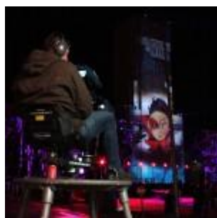
Retransmis en direct