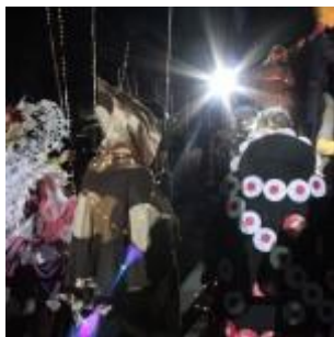
De superbes costumes