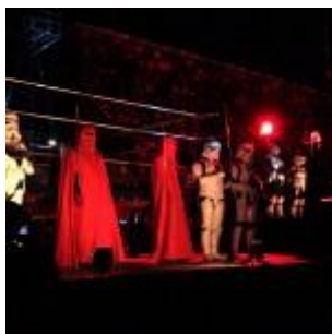
La 501e légion