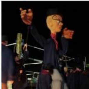
Une marionnette de mousse et de guenilles

Prenez une marionnette de mousse et de guenilles. Au pantalon élimé mais à l'allure fière et décontractée des paysans d'antan. Baptisez-la Sancho. À l'aide de bouts de ficelles, faites-lui grimper une église. Au sommet, plutôt que de lui faire contempler le paysage, demandez-lui de décrocher la lune. Elle est pendue, juste là, entre les espoirs et les tempêtes. Sancho Gille saura quoi en faire.